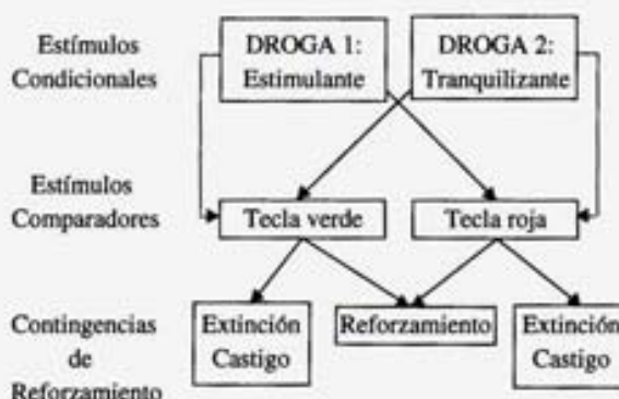
Figura 1. Representación esquemática del procedimiento básico de discriminación condicional de estados fisiológicos inducidos por drogas.

Pero supongamos que el experimento representado en la Figura 1 ha sido diseñado por un principiante, cometiendo el error metodológico de administrar cada droga de forma diferente (por ejemplo usando vías diferentes de administración y personas distintas para administrar cada una). En tal caso, surgiría la duda razonable sobre lo que el animal estaba discriminando: si el estado interno producido por la droga o las condiciones externas asociadas al ritual de su administración. Más aún, supongamos que sabemos que cada uno de los dos ayudantes encargados de administrar la droga se confundió de frasco en un 20 ó 30% de ocasiones, administrando en tales casos la droga que le correspondía a su compañero (esto es, administrando el estimulante cuando tenía que administrar el tranquilizante y viceversa).